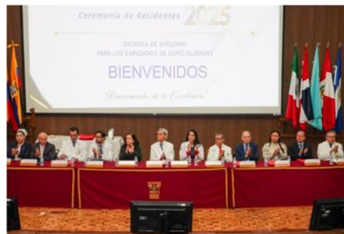
Ceremonia de graduación 2025