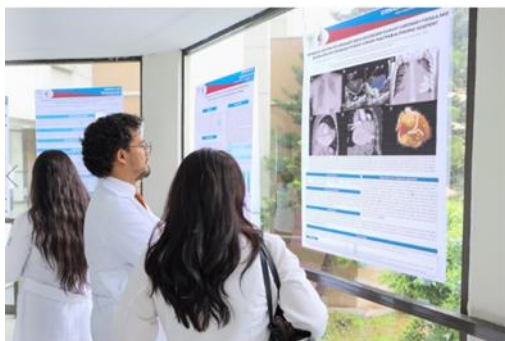
Jornada de Investigación para pasantes